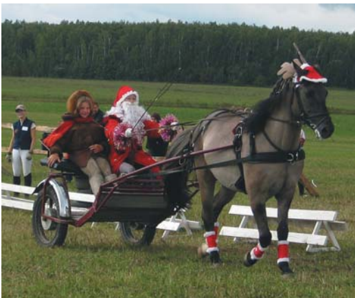
«Дед Мороз», «Снегурочка» и жеребец Белый Парус в роли «оленья»